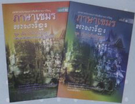
เอกสารประกอบการรับฟังวิทยุ