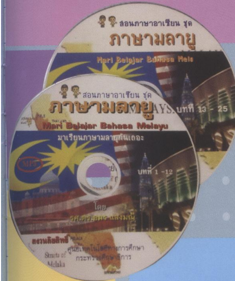
MP3 มาเรียนภาษามลายูกันเถอะ