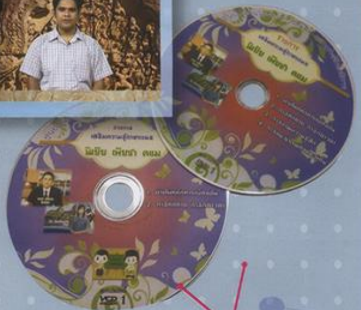
VCD รายการ นิเยีย เพียซา คมม