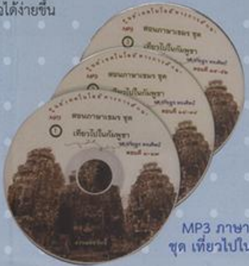
MP3 ภาษาเขมร ชุด เทียวไปในกัมพูชา